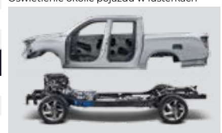
Nadwozie i rama ze stali o bardzo wysokiej wytrzymałości na rozciąganie