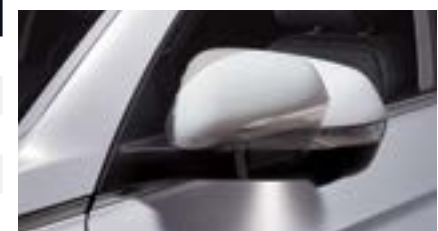
Oświetlenie okolic pojazdu w lusterkach