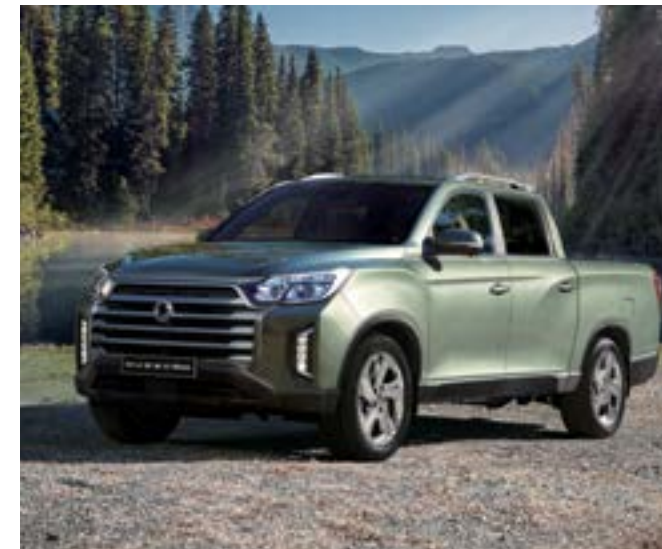
wersja Wild i Adventure Plus z Pakietem Executive