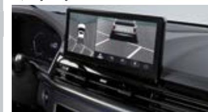
System kamer 360 stopni