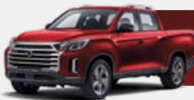
INDIAN RED (RAJ)