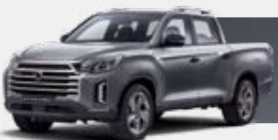
MARBLE GREY (ACM)