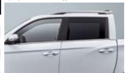
Przyciemiane tylne szyby