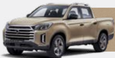
SANDSTONE BEIGE (EBK)