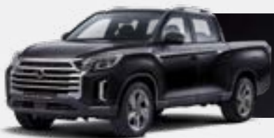
SPACE BLACK (LAK)