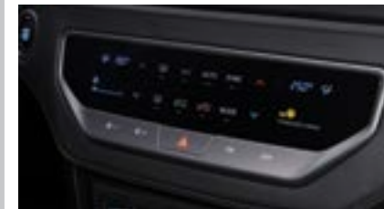
Automatyczna klimatyzacja dwustrefowa