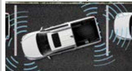
Czujniki parkowania przednie i tylne