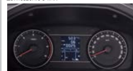
Zestaw wskaźników z 3,5" komp. pokładowym