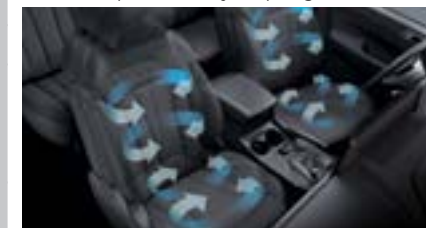
Siedzenia przednie wentylowane