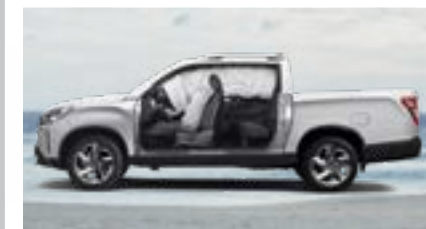
6 poduszek powietrznych