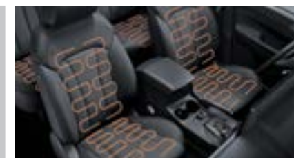
Siedzenia przednie i tylne podgrzewane