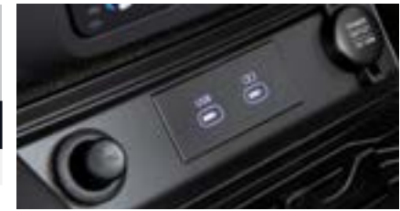
Gniazda USB typu C

LKAS - Asystent utrzymania pasa ruchu Tempomat adaptacyjny Elektryczne wspomaganie kierownicy Zderzak przedni z wlotem powietrza "Executive" w kolorze srebrnym LED-owe reflektory przednie Sekwencyjne kierunkowskazy przednie