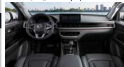
Nowe wnętrze z 12,3 calowym wyświetlaczem Android Auto / Apple CarPlay