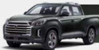
AMAZONIA GREEN (GAM)