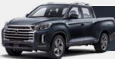
GALAXIES GREY (ADB)