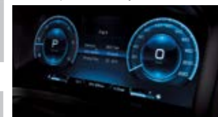
12,3 " cyfrowy zestaw wskaźników