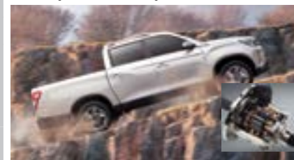
Blokada tylnego mostu (LD)