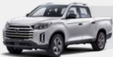
GRAND WHITE (WAA)