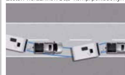
TSC - System kontroli kołysania przyczepy