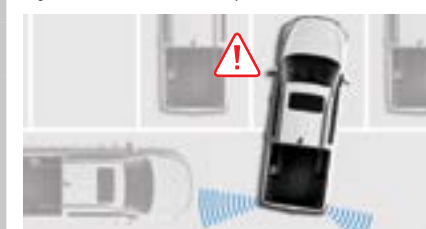
RCTA System monitorowania ruchu za pojazdem z asystentem