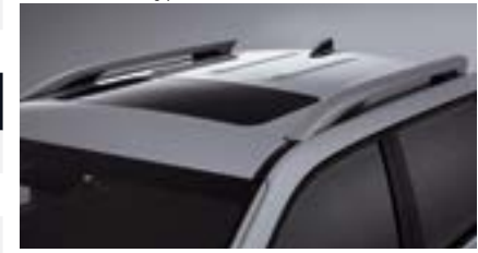
Relingi dachowe i szyberdach