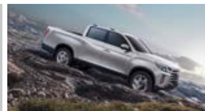
HDC – system kontroli zjazdu ze wzniesienia