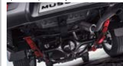
Zawieszenie na resorach piórowych